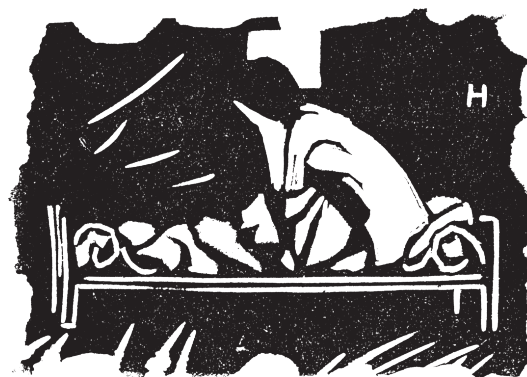
«מיטת נערה», תחריט מאת צבי גולן בירחון «שבתאי», ספטמבר 1913

בשתי שנותיו הראשונות בארץ, גר גולן בתל-אביב 26 . הוא הוקסם מבתי העיר ומתעוזת האדריכלים להגשים את הבנייה המודרנית, הושפע עמוקות מנופי הארץ ומהאור והצל האופייניים לה, וציוריו שינו את אופיים. עם הזמן החל להיות מוכר בחוגי הציור והפיסול והוזמן לבצע עבודות שונות, כמו קישוט בית כנסת באחד הקיבוצים הדתיים, עיצוב ארון