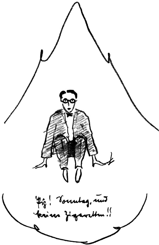
לעזאזל! יום ראשון, ואין סיגריות!! Pig! Sonntag, und keine Zigaretten!!

זה. ראיתי שיש לה עיניים יפות ועצובות. ורכנתי מעליה. שפתיי נגעו בשפתיה, שכלל לא היו לחות אלא יבשות ביותר. לחייה היו קודחות למגע. מובן שנשיקתי, שהתארכה כשבע עשרה פעימות לב, רעננה אותה.